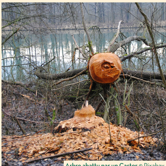
Arbre abattu par un Castor

Le Castor, animal territorial , s'installe dans le lit mineur des cours d'eau , aménageant des huttes de branchages extrêmement solides, parfois creusant des terriers en berge . Il est inféodé aux boisements de berge composés d'aulnes, frênes, saules, peupliers... dont il se nourrit (écorces et feuilles) et qu'il utilise pour ses huttes et barrages. L'activité d'un groupe familial (de 4 à 6 animaux) se déroule sur un linéaire de 1 à 3 km de cours d'eau.